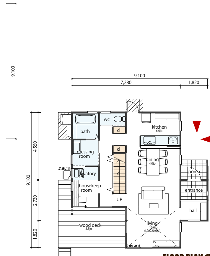
FLOOR PLAN 1F